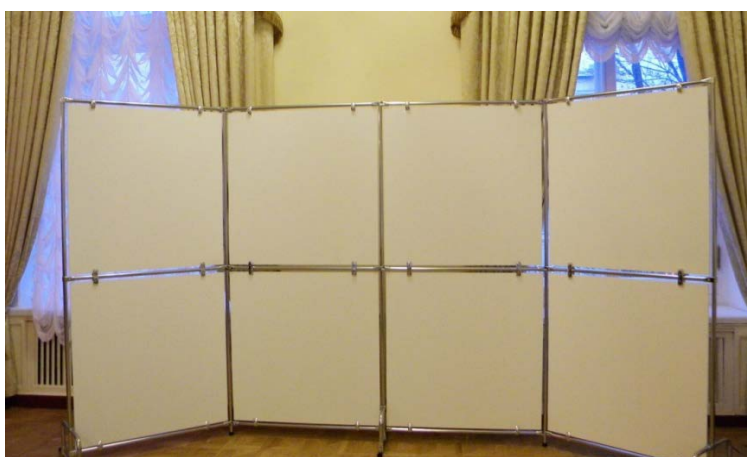
Примерный вариант: Стенд экспозиционный