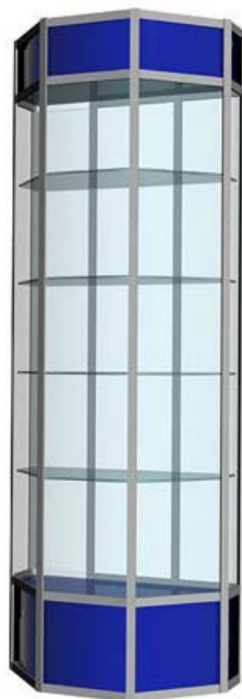
Примерный вариант: Витрина экспозиционная

Рис. 1. Модуль С «Разработка экскурсионных программ обслуживания / экскурсий», Модуль D «Проведение экскурсий»